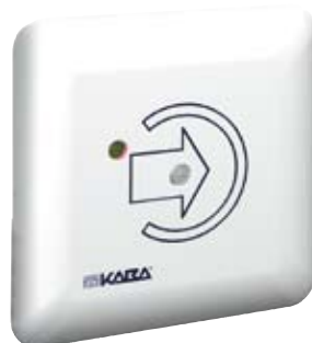
Kaba eolegic čtečka