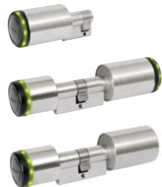
Kaba eolegic digitální vložka