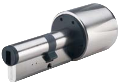
Kaba eolegic kompaktní vložka